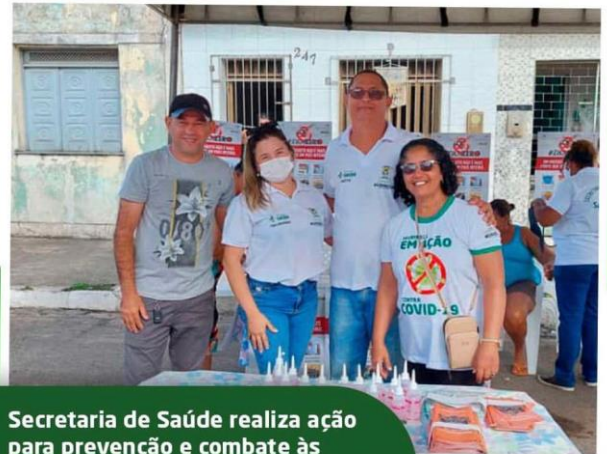
Secretaria de Saúde realiza ação para prevenção e combate às arboviroses