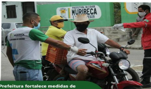
Prefeitura fortalece medidas de combate a proliferação do Covid-19 durante feira livre

ESTADO DE SERGIPE FUNDO MUNICIPAL DE SAÚDE SECRETARIA MUNICIPAL DE SAÚDE DE MURIBECA