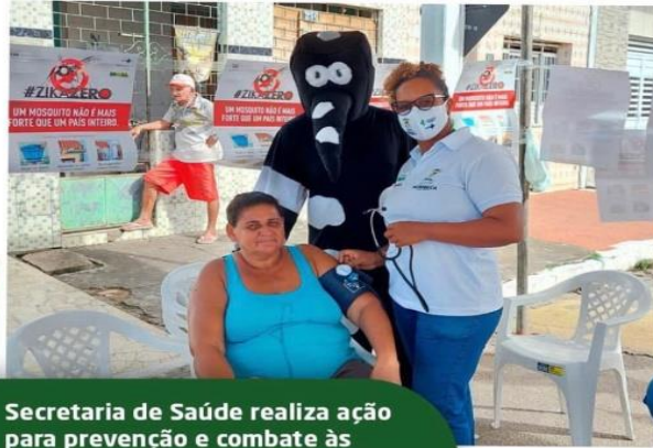
Secretaria de Saúde realiza ação para prevenção e combate às arboviroses