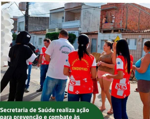
Secretaria de Saúde realiza ação para prevenção e combate às arboviroses