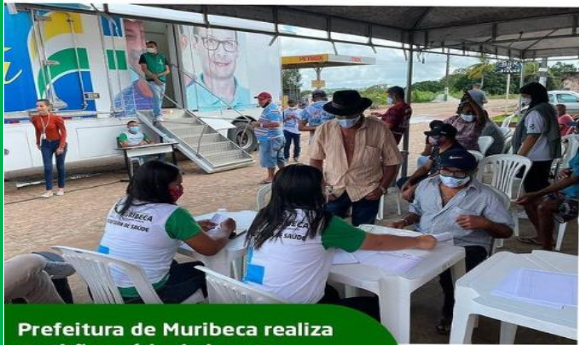
Prefeitura de Muribeca realiza mutirão saúde do homem

ESTADO DE SERGIPE FUNDO MUNICIPAL DE SAÚDE SECRETARIA MUNICIPAL DE SAÚDE DE MURIBECA