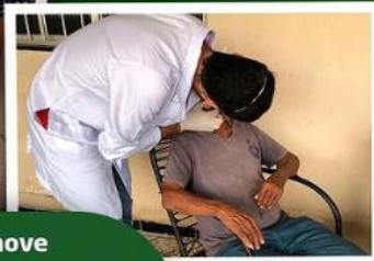
Prefeitura de Muribeca promove atendimentos odontológicos domiciliares