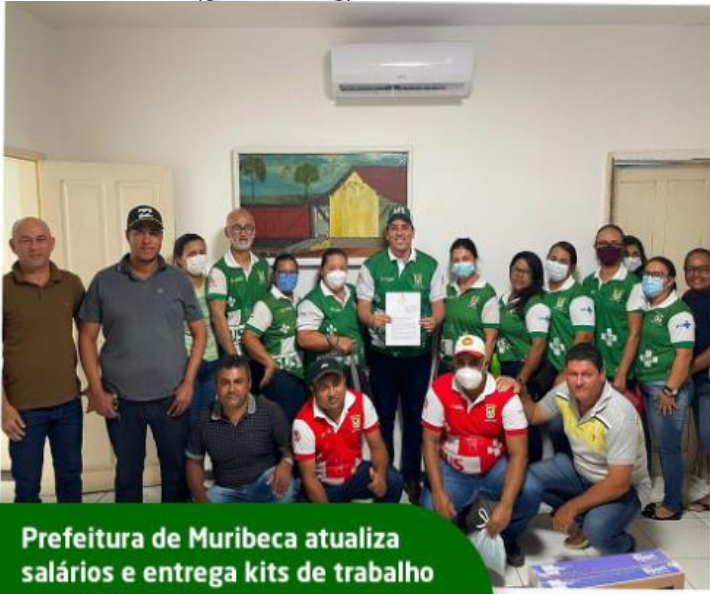
Prefeitura de Muribeca atualiza salários e entrega kits de trabalho para ACS e ACE

ESTADO DE SERGIPE FUNDO MUNICIPAL DE SAÚDE SECRETARIA MUNICIPAL DE SAÚDE DE MURIBECA