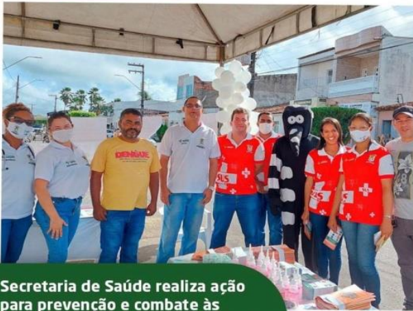
Secretaria de Saúde realiza ação para prevenção e combate às arboviroses