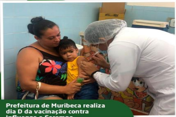
Prefeitura de Muribeca realiza dia D da vacinação contra Influenza e Sarampo

ESTADO DE SERGIPE FUNDO MUNICIPAL DE SAÚDE SECRETARIA MUNICIPAL DE SAÚDE DE MURIBECA