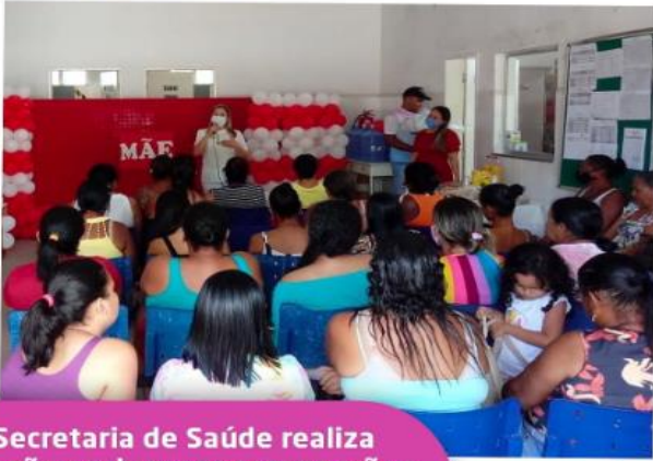
Secretaria de Saúde realiza ação em homenagem as mães

ESTADO DE SERGIPE FUNDO MUNICIPAL DE SAÚDE SECRETARIA MUNICIPAL DE SAÚDE DE MURIBECA