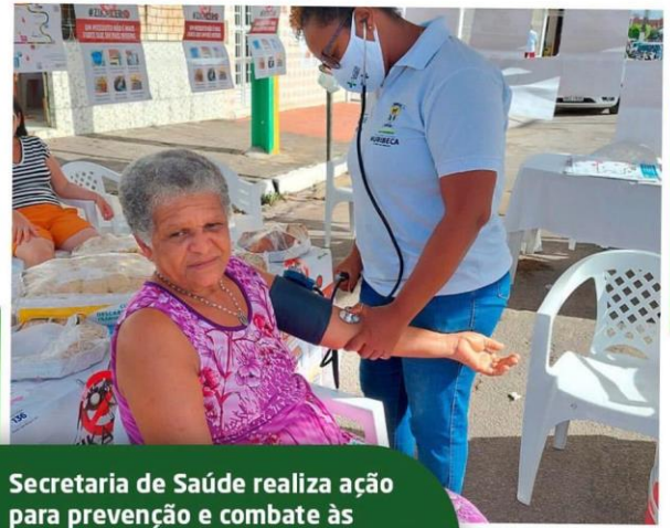
Secretaria de Saúde realiza ação para prevenção e combate às arboviroses